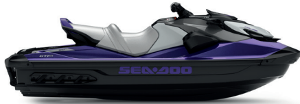
NEW Midnight Purple