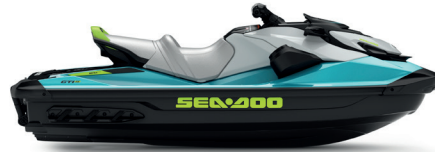
Teal Blue and Manta Green